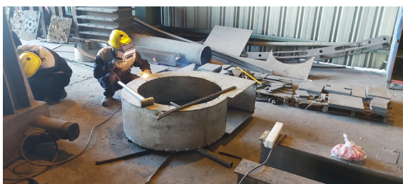
قطعیات خط ۴ ریخته گری

مدیرعامل و عضو هیئت مدیره شرکت صنایع فولاد مشیز بردسیر