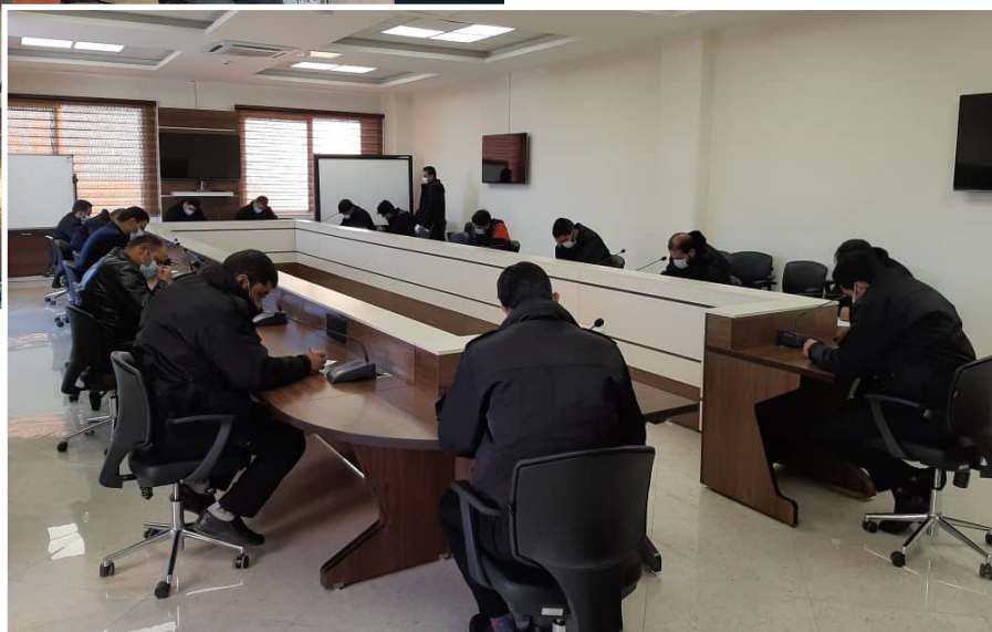
> آزمون حفاظت فیزیکی