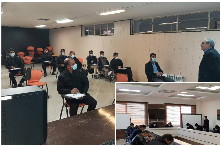
< برگزاری کلاس تخصصی حفاظت فیزیکی

اهمیت و نقش بازرسی و حفاظت فیزیکی در ارتقاء ضریب امنیت و حفاظت از سرمایه های ملی و سازمان ها بر کسی پوشیده نیست . آموزش ،بروزرسانی دانش و مهارت کارکنان واحد بازرسی و حفاظت فیزیکی نقش تعیین کننده ای در آمادگی و جلوگیری از تهدیدات و آسیب های احتمالی به اماکن و تاسیسات دارد. بازرسی و نظارت هر جا گام گذارد، نه برای ایجاد مشکل و بازدارندگی در امر تولید ، بلکه باید برای اصلاح و حل مشکلات و ارائه راه حل های کاربردی و تصمیم سازیهای مفید و موثر باشد. به عبارت دیگر نظارت و بازرسی فراهم آورنده، اطلاعات مناسب، مفید و لازم برای مدیریت اثربخش و قابل اطمینان در یک سازمان انسانی و متعالی است . مدیران سازمان باید اطمینان داشته باشند که برای به حداقل رساندن خطرات طبیعی و یا انسانی به دلیل